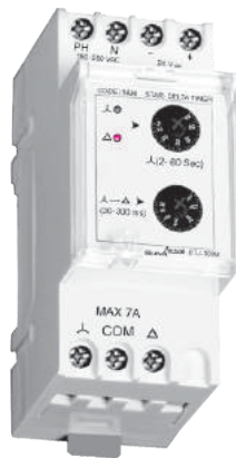
MODEL : DTJ-300M CODE:14J4 WEIGHT : 118 gr (36x86x65) mm IP30